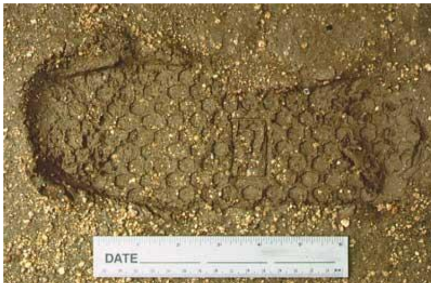
Pic. 3. Exemple de gros plan du détail avec une règle