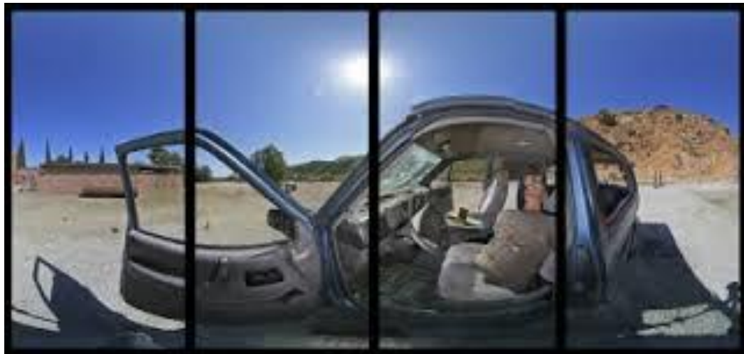
Pic. 1. Exemple de photo de reconstitution composée d'une série de plans panoramiques qui se chevauchent

La photographie de reconstitution enregistre l'ensemble de la scène du crime exactement comme la personne l'a trouvée. Cela implique une série de plans panoramiques individuels qui sont pris avec un chevauchement suffisant pour fournir une vue d'ensemble de la scène. Cela permet aux enquêteurs/juges de reconstituer les circonstances des crimes aussi précisément que possible. Si possible, incluez un marqueur indiquant la direction du nord pour enregistrer l'emplacement géographique de la scène aussi précisément que possible. 94