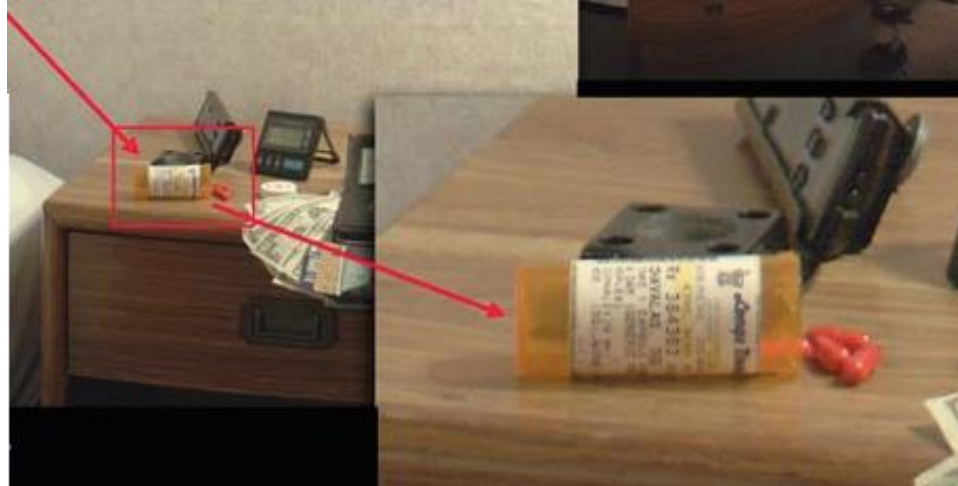
Pic. 2. Exemple de prise en gros plan et à distance moyenne